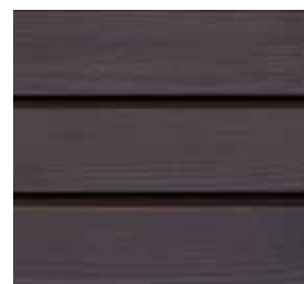
Farbton Nr. 4890-M