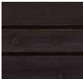
Farbton Nr. 4890