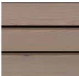
Farbton Nr. 4863