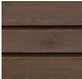
Farbton Nr. 4470