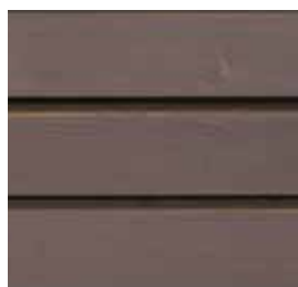
Farbton Nr. 4470-M