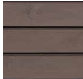
Farbton Nr. 4832