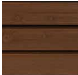
Farbton Nr. 4735