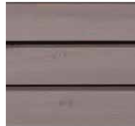
Farbton Nr. 4861