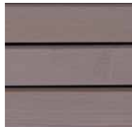
Farbton Nr. 4875