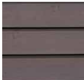
Farbton Nr. 4870