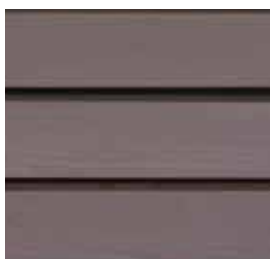
Farbton Nr. 4259-M