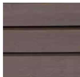
Farbton Nr. 4832-M