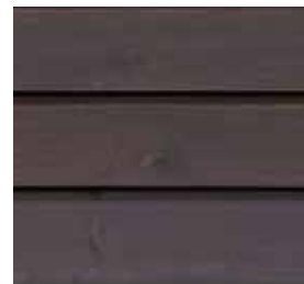
Farbton Nr. 4880