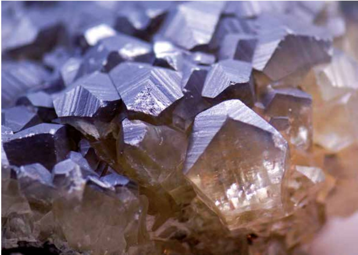
Quarz – der Grundstoff für das silikatische Bindemittel „Wasserglas“ oder „Kaliumsilikat“